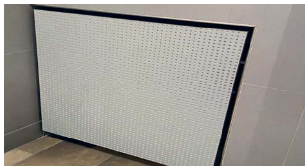
Trapă de vizitare cu perforații pentru capac radiator

La cerere pot fi realizate dimensiunile personalizate în orice dimensiune dorită.